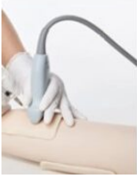
Using the ultrasound